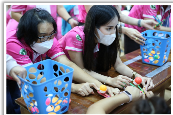
ร่วมคิด ร่วมทำ ร่วมนำองค์กร