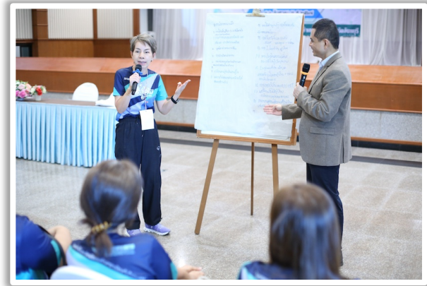
ไปคนเดียวไปไว ไปไกลต้องไปด้วยกัน

ผู้เข้าอบรมมีความเชื่อมั่นต่อการนำความรู้ที่ได้รับไปปรับใช้กับการปฏิบัติงานและให้บริการ มีความสุขเกิดความรักความผูกพันภายในองค์กร